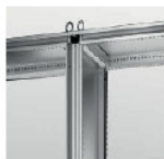
Set de séparation interne