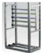
Système de barres intérieures