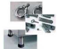
... et bien sûr les accessoires standard