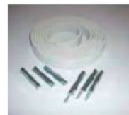
Kit de jonction